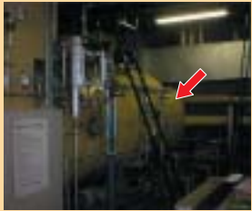
石綿含有保温材 (ボイラ外周部)