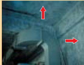
吹付アスベスト・石綿含有吹付ロックウール (吸音用)