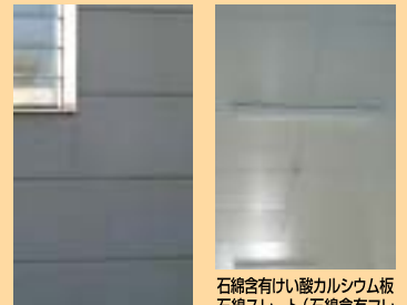
石綿セメント・サイディング