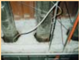
吹付アスベスト・石綿含有吹付ロックウール (S造の耐火被覆)