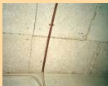
木毛セメント板打ち込み