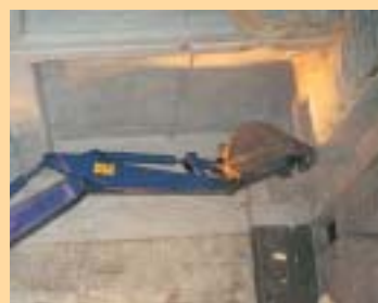
発泡ウレタン断熱材吹きつけ