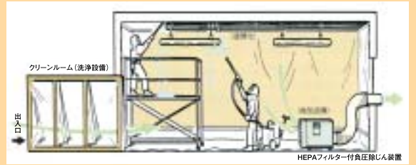
図 吹付けアスベスト除去等における隔離養生等