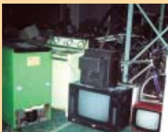
特定家庭用機器 (エアコン、テレビ、冷蔵庫、冷凍庫、洗濯機)