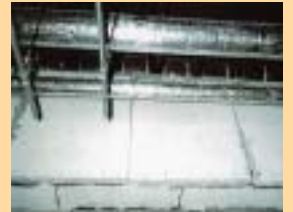
石綿含有ケイ酸カルシウム板 (2種) (S造の耐火被覆)