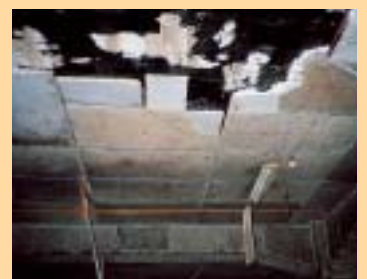
発泡ポリスチレン打ち込み