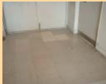
ビニール床タイル (石綿含有)