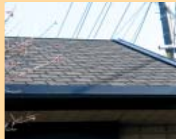
住宅屋根用平板石綿スレート