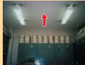
石綿含有バーミキュライト吹付 (天井)