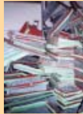
保温材ダクトパッキン材