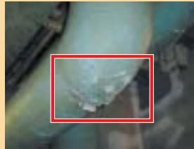
石綿含有保温材 (配管曲がり部)