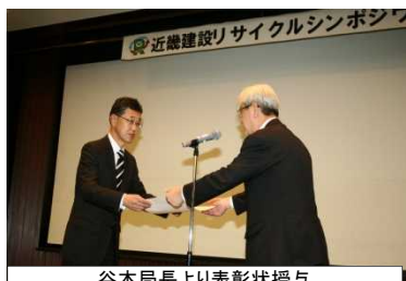
谷本局長より表彰状授与