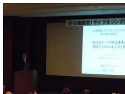
有限会社 ラルス 渋谷氏