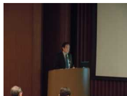
田中建材 株式会社 田中氏