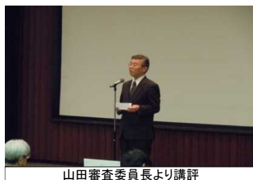
山田審査委員長より講評